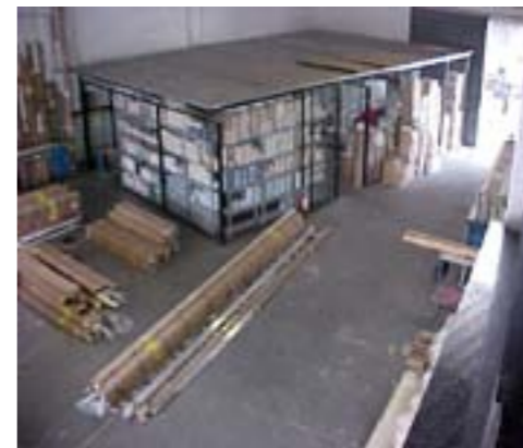
Um antes e depois do setor de estoque da Fastlux (Matriz)

Seiri: Separar e descartar; Seiton: Ordenar e Organizar; Seiso: Limpar e inspecionar; Seiketsu: Saúde; Shitsuke: Autodisciplina.