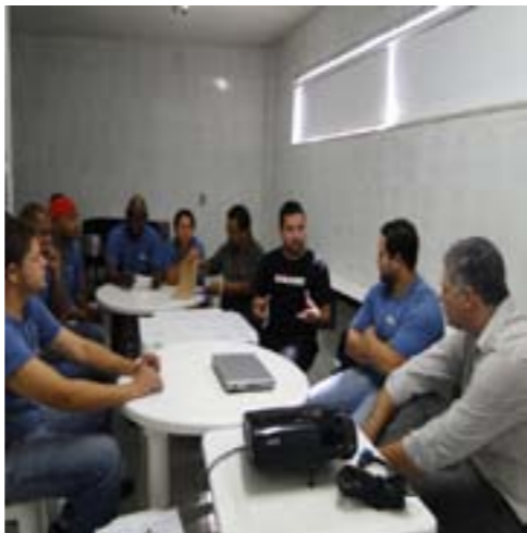
Reunião entre Diretor, colaboradores e representantes do Sindicato define indicadores para 2011

Para este ano, a empresa juntamente com a comissão inseriu na PLR um novo indicador, este que será importante, pois envolverá literalmente toda a equipe, Departamento de PCP, Vendas, Cobrança e Produção. Este indicador irá estabelecer basicamente o tempo de produção gasto, ou seja, desde o momento que o pedido chega na fábrica até sua saída.