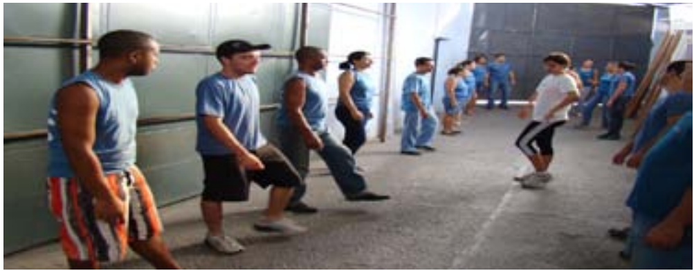
Colaboradores da Fastlux em ação na Ginástica Laboral

Promover o bem estar geral; Melhorar a qualidade de vida; Combater o sedentarismo; Diminuir o stress ocupacional; Melhorar a coordenação motora e a flexibilidade músculo - articular; Promover a integração social dos funcionários; Pro-